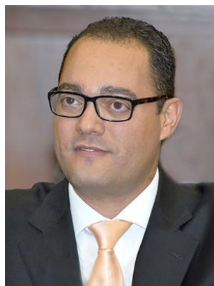
DEPUTADO VIRMONDES CRUVINEL – PPS