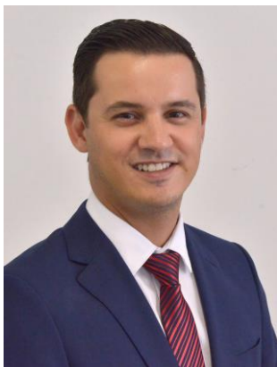
DEPUTADO RAFAEL GOUVEIA-DC