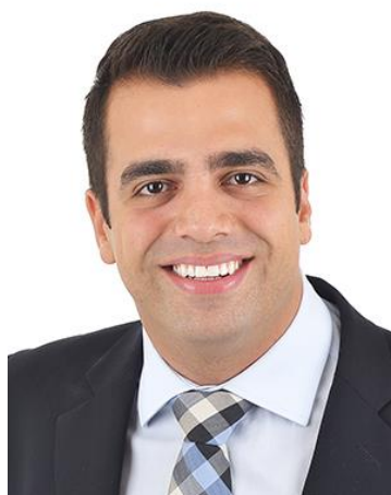
DEPUTADO GUSTAVO SEBBA – PSDB