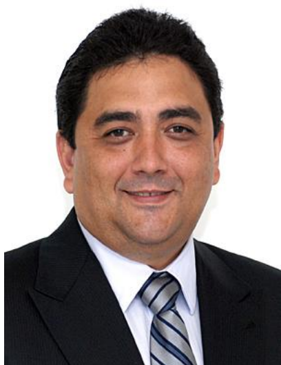
DEPUTADO TALLES BARRETO - PSDB