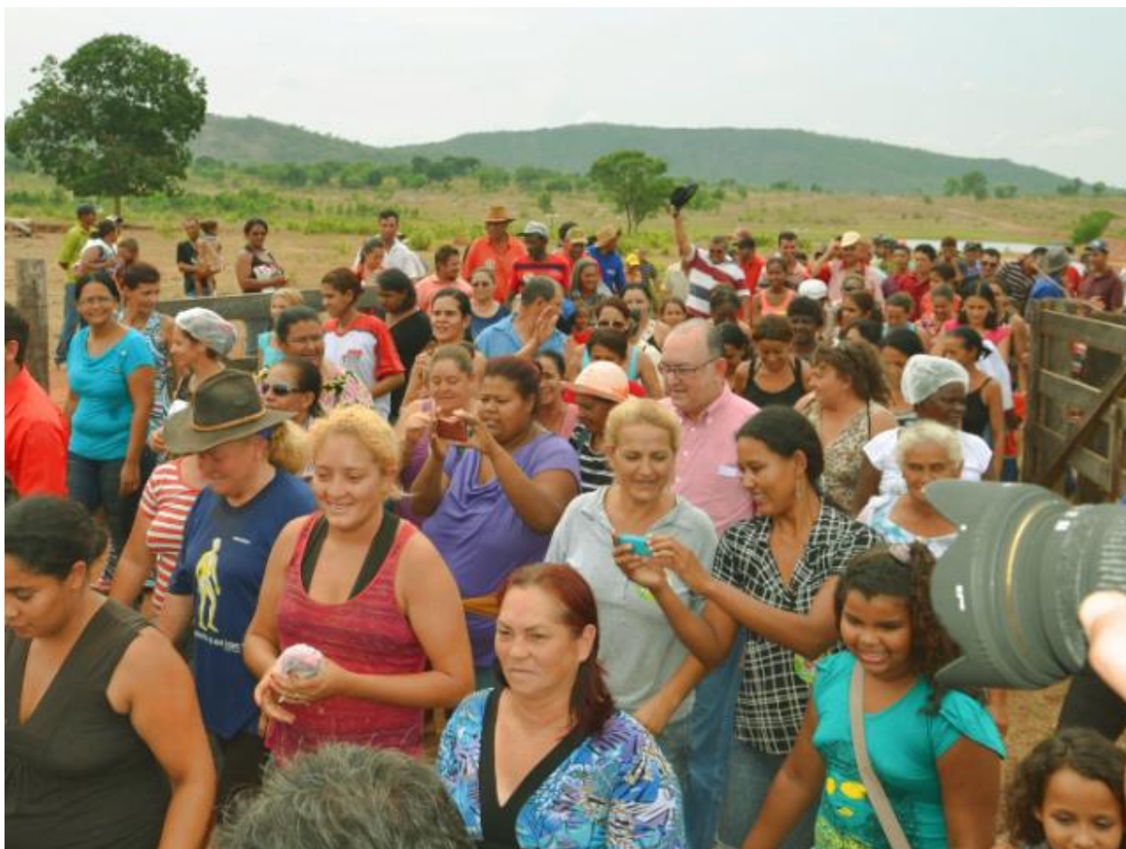
Assentamento Plínio de Arruda Sampaio