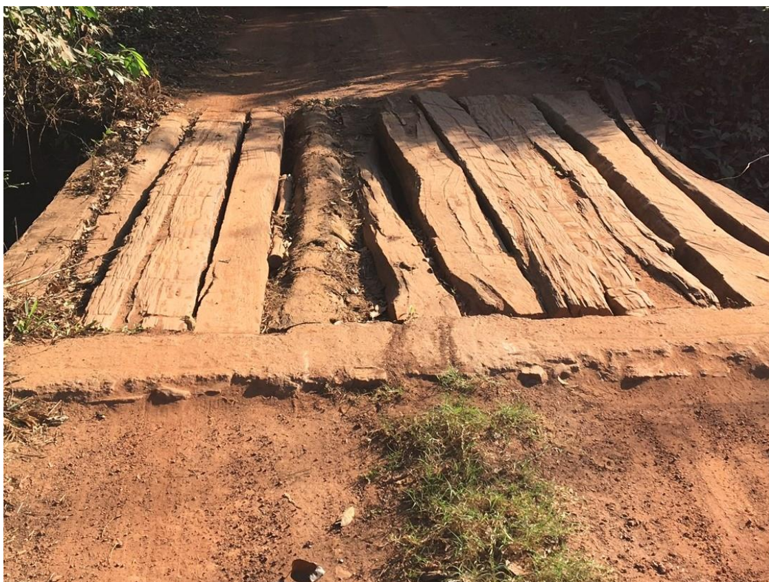
Ponte de acesso ao assentamento em mau estado de conservação

As famílias noticiaram e demonstraram sua preocupação com a evasão escolar e dificuldade de acesso à escola, já que o ônibus que atende as crianças está sucateado, não oferece a segurança necessária e não consegue acessar todas as parcelas, tendo algumas crianças que percorrer longas distâncias para acessar o ponto mais próximo de passagem do ônibus escolar.