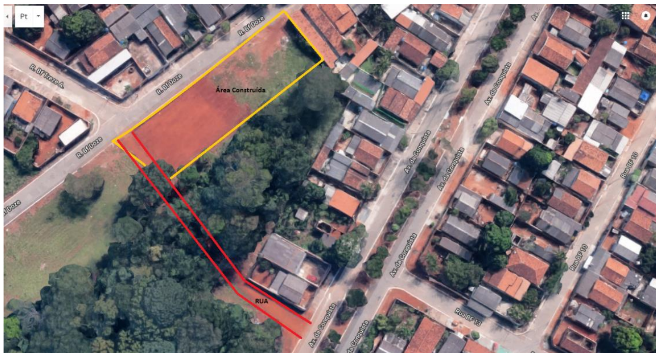
Delimitação da área construída no Bairro Floresta.

Os moradores esclareceram que na área que a Prefeitura alega ser de preservação ecológica há 11 (onze) lotes, alguns com construção já concluída e outros ainda em andamento.