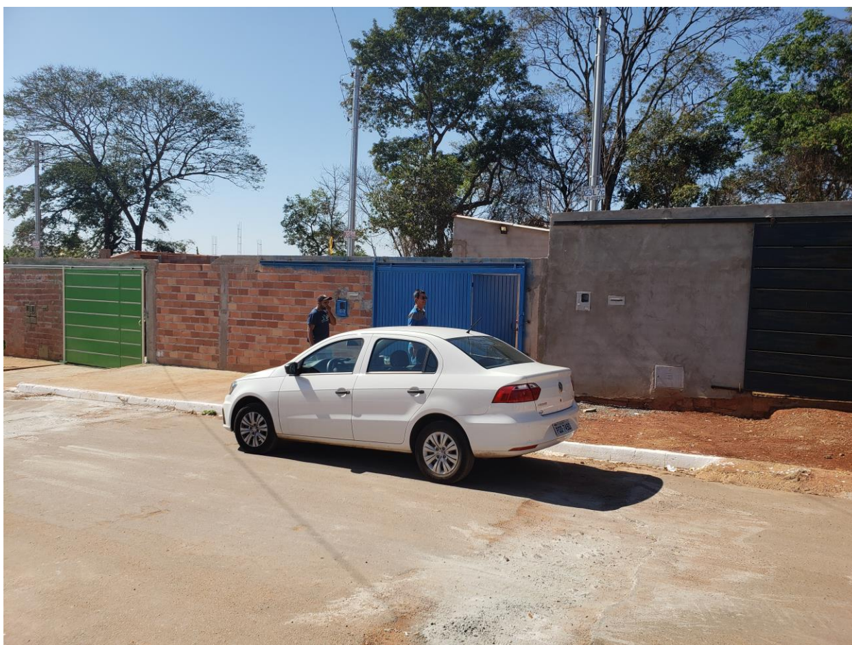
Rua BF 13-A do Bairro Floresta.

No dia 21/08/2018, a equipe técnica da Comissão de Habitação, Reforma Agrária e Urbana da Assembleia Legislativa de Goiás fez uma visita técnica ao Bairro Floresta para verificar de perto a solicitação dos moradores.