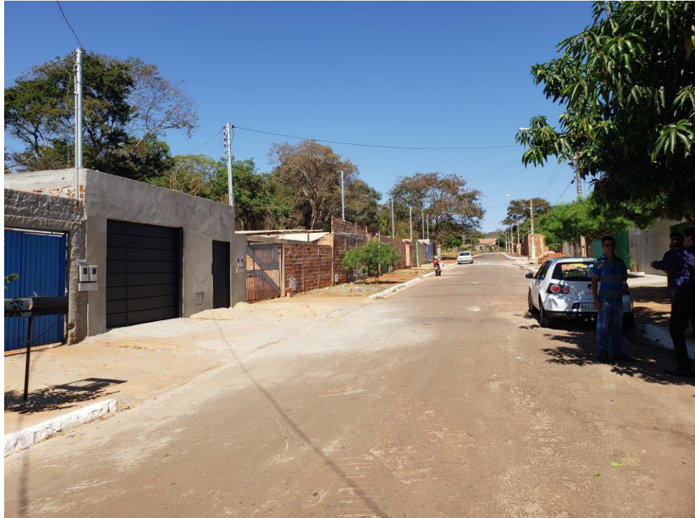
Casas já construídas na Rua BF 13-A do Bairro Floresta.