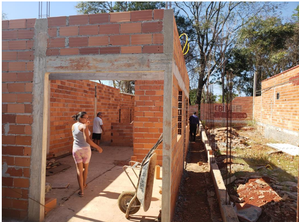
Casas ainda em construção na Rua BF 13-A do Bairro Floresta.