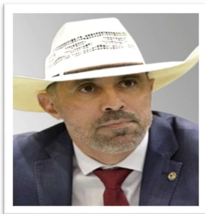
Deputado Amauri Ribeiro (PATRIOTA)