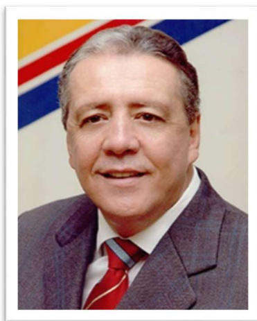
Deputado Tião Carozo (DEM)