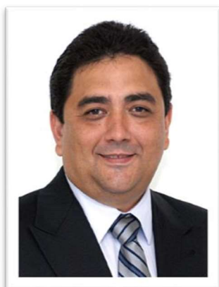
Deputado Talles Barreto (PSDB)