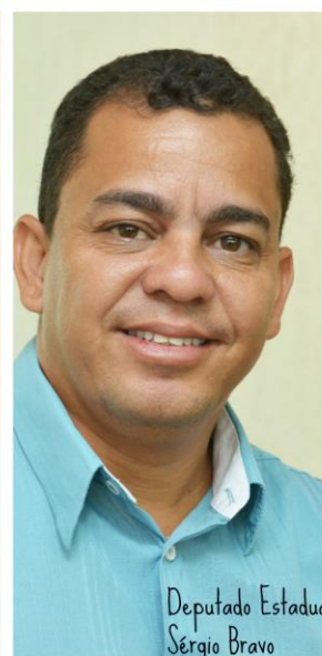
Deputado Estadual Sérgio Bravo