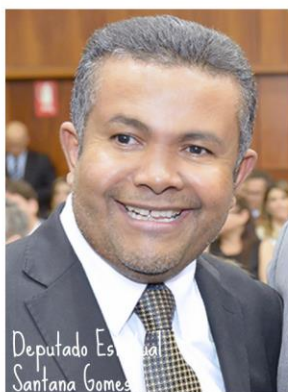
Deputado Estadual Santana Gomes