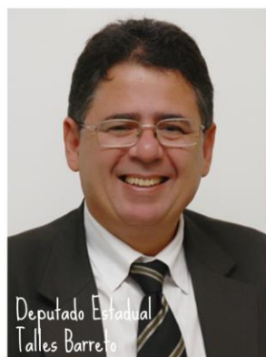
Deputado Estadual Talles Barreto