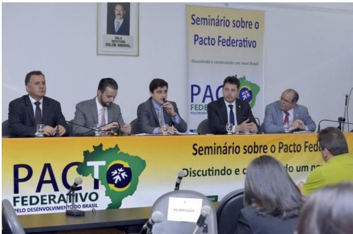
Figura 1 - Seminário sobre o Pacto Federativo

O objetivo do Seminário foi levantar propostas advindas dos prefeitos dos municípios goianos no sentido de viabilizar um novo pacto federativo que contemple de maneira mais igualitária os entes da federação. Além da discussão principal do Seminário, que eram as questões tributárias, debateu-se sobre a necessidade em se rever as competências de cada ente federado.