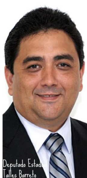
Deputado Estadual Talles Barreto