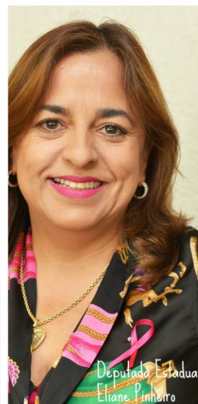
Deputada Estadual Eliane Pinheiro