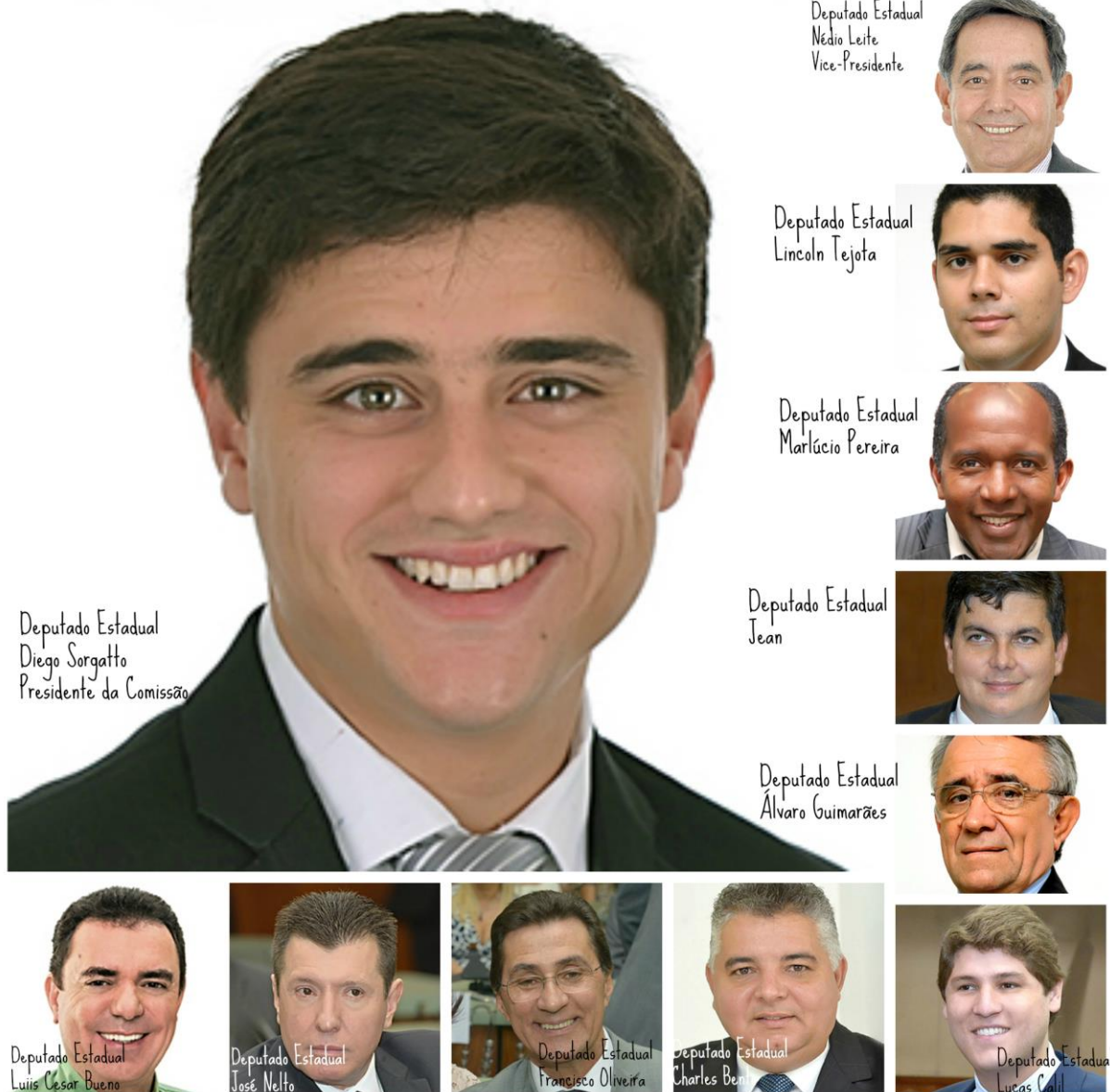
Deputado Estadual Diego Sorgatto Presidente da Comissão

A Comissão Permanente da Assembleia Legislativa do Estado de Goiás é constituída por 22 membros (11 titulares e 11 suplentes respeitando sempre a proporcionalidade partidária), conforme definido pelo Regimento Interno (Resolução n. 1218 de 03 de julho de 2007).