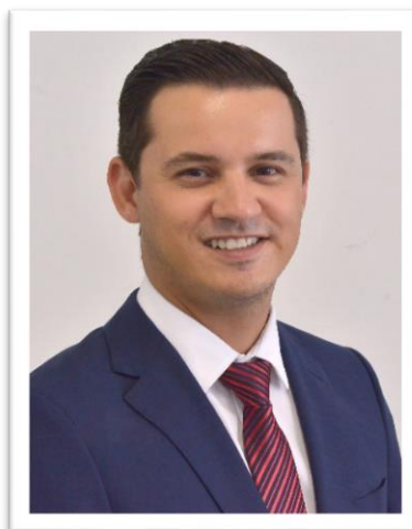
Deputado Rafael Gouveia (REPUBLICANOS)