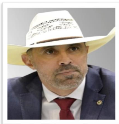
Deputado Amauri Ribeiro (UB)