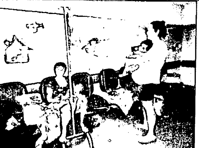
28.5. Sala de espera com crianças aguardando vagas na rede SUS, internadas nas cadeiras e em uso de oxigênio