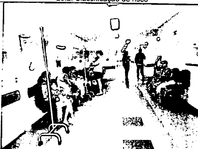
28.4. Sala de espera com crianças aguardando vagas na rede SUS, internadas nas cadeiras e em uso de oxigênio