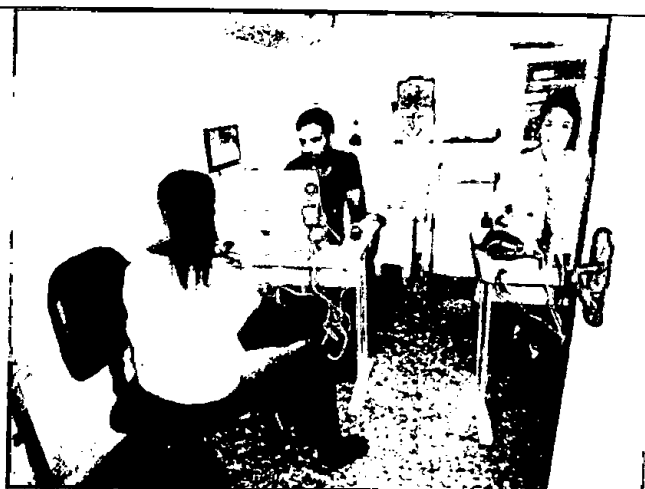
28.2. Classificação de risco