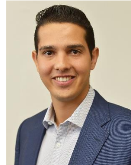
Deputado Zé Antônio (PTB) Mandatos: 2015/2019 Gabinete: 104