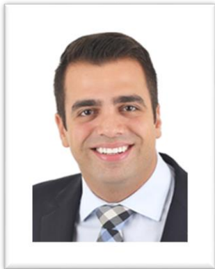
PRESIDENTE - GUSTAVO SEBBA – PSDB