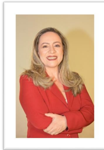
DEL. ADRIANA ACCORSI – PT